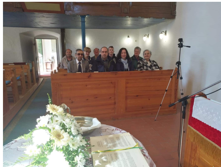
a presbiteri hétvége résztvevői az iszkaszentgyörgyi templomban

A nyári gyerek- és ifjúsági táborunkat július 15. és 19. között szervezzük Szóládra (a Balaton déli partja). Az 5 nap ára 24 000 Ft. Várjuk a jelentkezéseket és a befizetéseket.